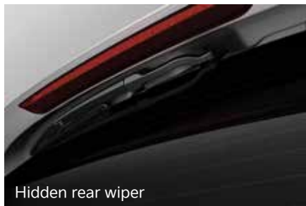
Hidden rear wiper