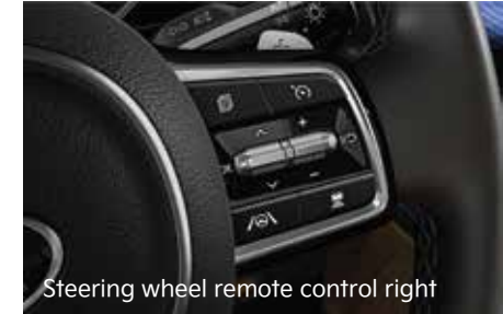
Steering wheel remote control right