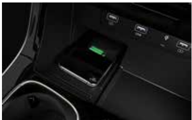
Smartphone Wireless Charger