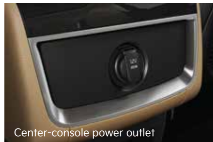
Center-console power outlet