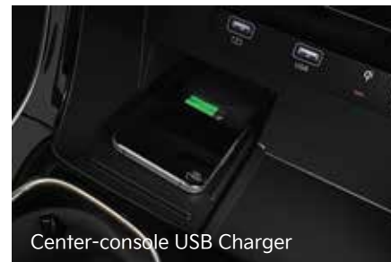
Center-console USB Charger