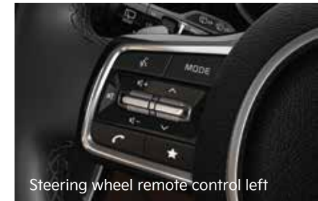
Steering wheel remote control left