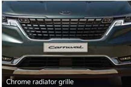
Chrome radiator grille

Kia Grand Carnival menawarkan banyak fitur canggih, dibalut dengan perpaduan warna dan desain yang berkelas serta nyaman untuk berkendara, sehingga anda dapat merasa seperti berada di rumah meskipun sedang mengeksplor tempat baru..