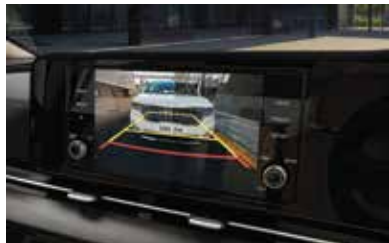
Surround View Monitor