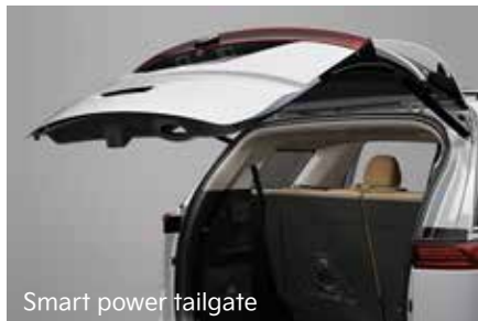
Smart power tailgate