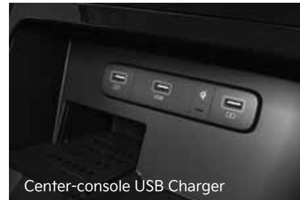
Center-console USB Charger