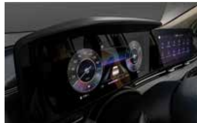
12.3 Inch Digital Cluster