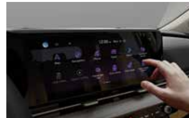
12.3 Inch Head Unit