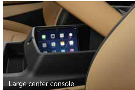
Large center console