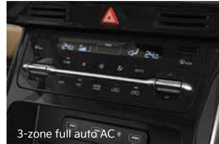
3-zone full auto AC