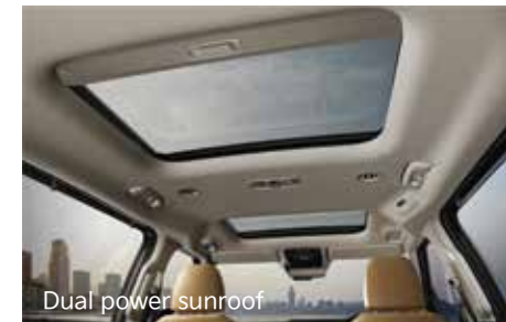
Dual power sunroof