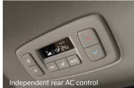
Independent rear AC control